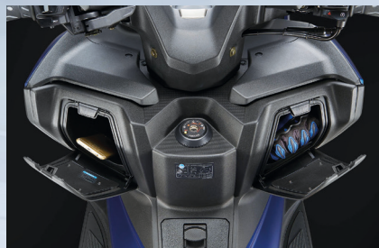
Zentralverriegelung Verrouillage centralisé