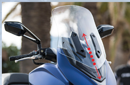
Einfach verstellbare Windschutzscheibe Pare-brise réglable manuellement et facile

Le comportement dynamique du XCITING S 400i avec ABS est appuyé par un nouveau design des plus réussi dans lequel s'intègre parfaitement un éclairage Full LED à l'avant et à l'arrière.