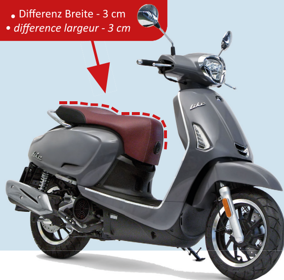
New Like 125i CBS Euro 4 New Like 50i (45 km/h) Euro 4

Accessoire: Sattel gesenkt / selle abaissée • Differenz Höhe - 2,5 cm • difference hauteur -2,5 cm • Differenz Breite - 3 cm • difference largeur - 3 cm